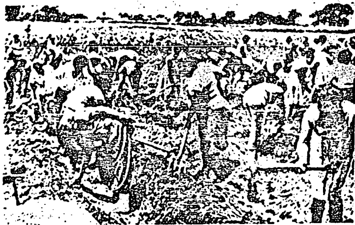
Devido à resistência do camponês pelas imposições da Reforma Agrária Comunitária, o Regime tem tido que obrigar as mulheres a fazer trabalho de lavoura.

Como se vê, a Lei pretende organizar Craxias estatais e o fato de se referir a uma "etapa inicial" não diminui tal juízo, já que não enumera os princípios cooperativos. Tudo fica nas mãos do I.N.R.A., que não procedeu a nenhuma regulamentação tendente a "mais ampla autonomia". E, além disso, não se "fomentou" senão que se "fez" isto é, não foi permitida a livre iniciativa do camponês.