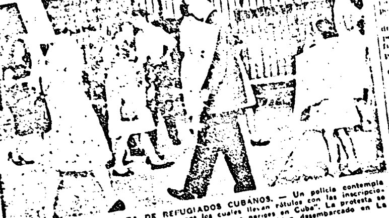
WASHINGTON. — PROTESTA DE REFUGIADOS CUBANOS. — Un policía contempla el paso de un piquete de refugiados cubanos los cuales llevan peticiones con las inscripciones: "Rusia, Vietnam a Moscú" y "Rusos no maten sus hermanos en Cuba". La protesta se originó ante el anuncio de que tropas y técnicos soviéticos habían desembarcado en La Habana.