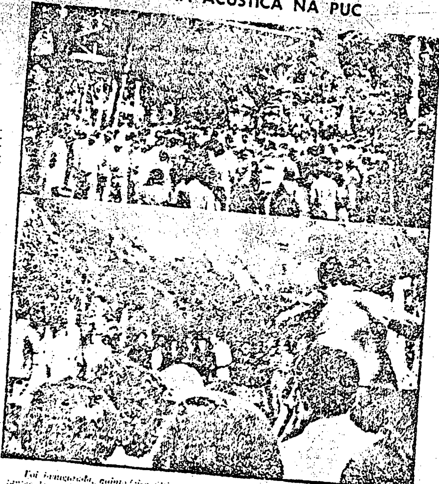
Foi inaugurada, quinta-feira última, com a presença de várias autoridades, representantes de entidades estudantis e colegas da Universidade, a primeira concha acústica do Rio de Janeiro, localizada no prédio da Universidade Católica, com esta peça indispensável às atividades deste setor nos próximos anos, com a inauguração da magnífica mostra artística do Corpo de Bombeiros para a comemoração de abertura. Na foto, um aspecto de sua cerimônia quando, representando os docentes da Concha — Ilmo Sr. Presidente da Comissão — faz o discurso de inauguração.

Em 1962, o P.C. mudou-se para Havana e aderiram a ele os estudantes de Direito da Universidade de Havana. Em 1962, o P.C. mudou-se para Havana e aderiram a ele os estudantes de Direito da Universidade de Havana.