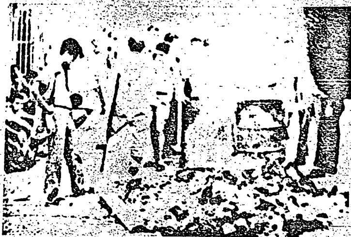
Encontram-se nas mais ínfimas condições. (nota-se o lixo chão, e a falta de assistência médica).

O Povo, de fato, apoiou Castro em seu programa.