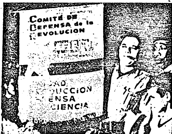
Os membros dos C. D. R. são os instrumentos para coagir o povo.

• Já mais diretamente, têm a seu cargo a vigilância os "Comitês de Defesa da Revolução" e os agentes do "Departamento de Segurança do Estado".