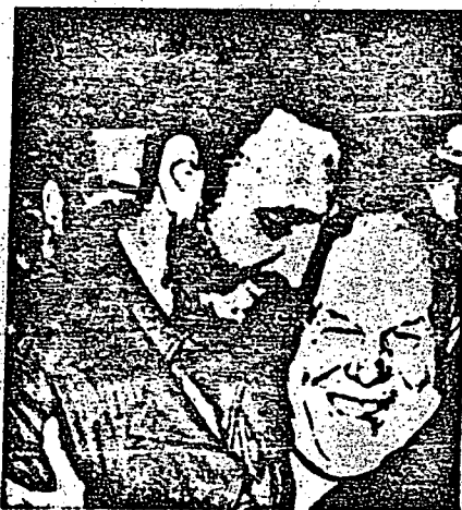
A entrega de Cuba ao Bloco Socialista tem trazido fome e opressão ao povo cubano o que parece fazer rir a Fidel e Nikita unidos em íntimo abraço.

Muito mais lúcido foi o "camarada" Ernesto "che" Guevara. Fidel demorou mais, porém já proclamou seu pensamento. E assim, a 13 de março de 1961, declarou pomposamente: "Por isso, vista a questão de força contra força, o poderio do imperialismo é um poderio decadente face ao da União Soviética, da República Popular da China e dos países socialistas".