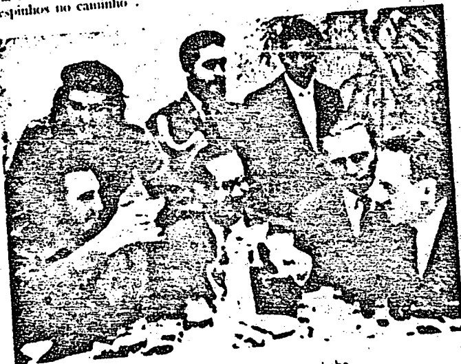
Enquanto a "Nova Classe" come e bebe...

Nessa mesma noite, Fidel falou com amargura e anunciou o próximo racionamento. Disse que "a situação põe à prova a capacidade da Revolução e dos revolucionários. Nem tudo são rosas. Há também espinhos no caminho".